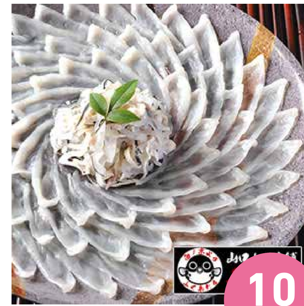
とらふぐ刺身 (4人前/約100g)