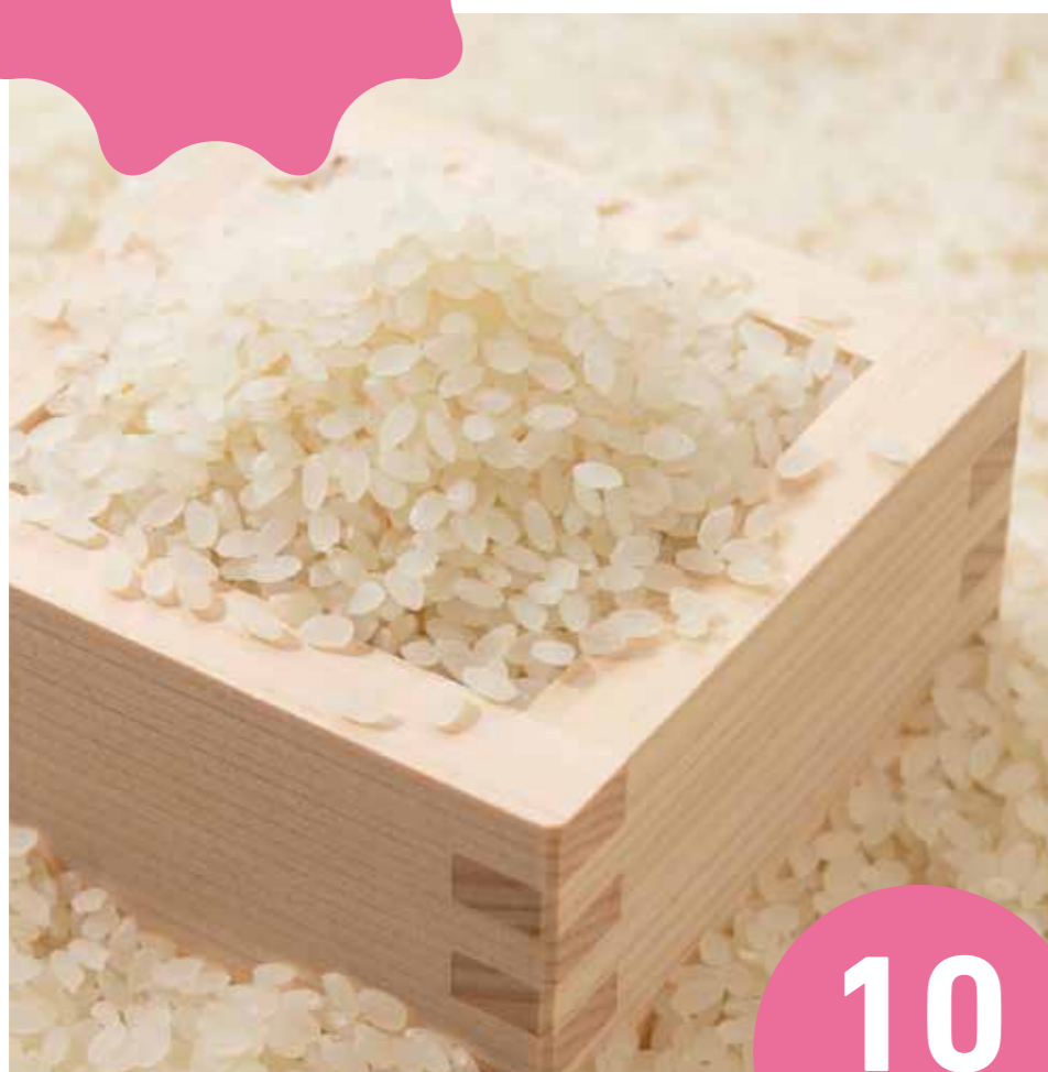
千葉県産 ミルキークイーン (5kg×2袋)