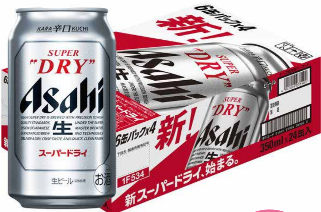
アサヒ スーパードライ 缶 (350ml ×24缶)